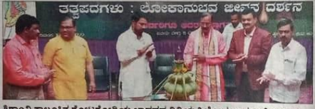
ತತ್ವಪದಗಳು : ಲೋಕಾನುಭವ ಜೀವನ ದರ್ಶನ

ಕರ್ನಾಟಕ ವೈಭವ-ವೈಚಾರಿಕ ಹಬ್ಬದ ಪ್ರಯುಕ್ತ ತಾಲೂಕಿನ ಗೋಟಗೋಡಿಯ ಕರ್ನಾಟಕ ಜಾನಪದ ವಿಶ್ವವಿದ್ಯಾಲಯದ ಅಧಿಕೃತ ಭವನದ ಆವರಣದಲ್ಲಿ ರಾಣಿಬೆನ್ನೂರಿನ ಪರಿವರ್ತನ ಹಾಗೂ ಕಣವವಿಯ ಪರಂಪರೆ ಒಕ್ಕೂಟದ ನಡವಳಿಯಲ್ಲಿ ನೋವುಪಾದ ಅಯೋಜಿಸಿದ್ದ 'ತತ್ವಪದಗಳು ಲೋಕಾನುಭವ ಜೀವನ ದರ್ಶನ' ಕಾರ್ಯಕ್ರಮ ಉದ್ಘಾಟಿಸಿ ಅವರು ಮಾತನಾಡಿದರು.